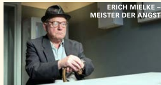
ERICH MIELKE – MEISTER DER ANGST