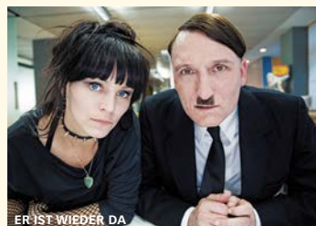
ER IST WIEDER DA