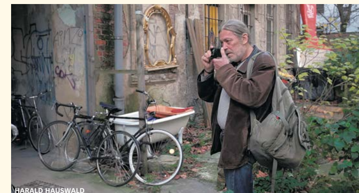
FOTO: OSTKREUZ Doku, D 2015, 89'. Regie: Maik Reichert RADFAHRER Doku, D 2009, 27'. Regie: Marc Thümmler

RADFAHRER konfrontiert Schwarz-Weiß-Fotografen Harald Hauswalds mit Beobachtungen der Stasi über den Fotografen. Zu sehen sind Bilder, die Harald Hauswald im Ost-Berlin der achtziger Jahre aufgenommen hat; aus dem Off zu hören sind Auszüge aus Hauswalds Stasi-Akte.