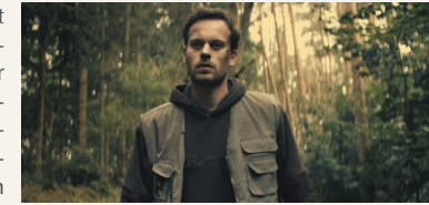
„Fargo in Mecklenburg-Vorpommern“